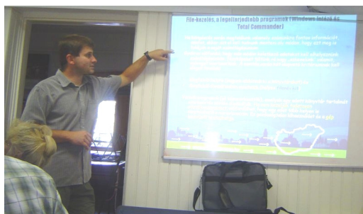
A KIHOP internet tanfolyam az iskolában, lent a gyerekeknek tartott internet oktatáson készült fotó látható.